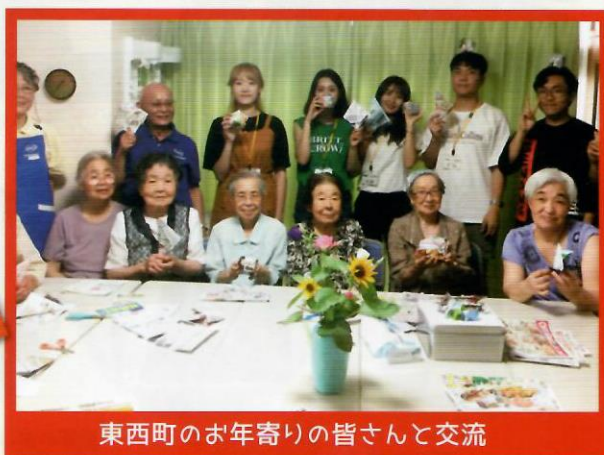
東西町のお年寄りの皆さんと交流