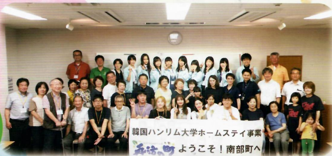
協会関係者で大学生の歓迎会を開催