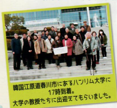
韓国江原道春川市にあるハンリム大学に17時到着。 大学の教授たちに出迎えてもらいました。

23年間交流を続ける韓国・ハンリム大学日本学科を国際交流協会のメンバー26人が訪問し、今後の交流継続について大学側と意見交換会をし、友好の絆を深めました。