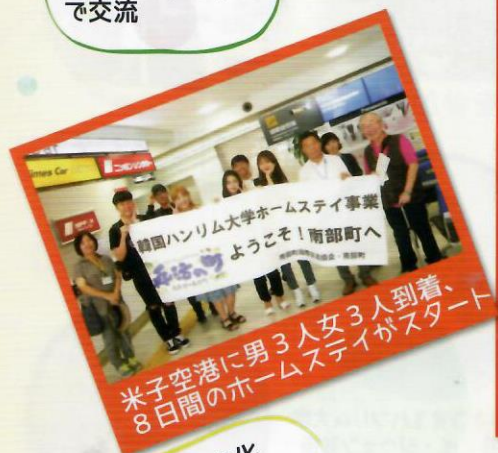
米子空港に男3人女3人到着、8日間のホームステイがスタート