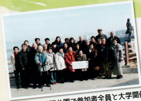
春川市内の湖畔公園で参加者全員と大学関係者

今回の韓国交流の旅、ホストファミリーの皆さんはそれぞれに韓国の子どもたちと再会し交流の絆を深めました。