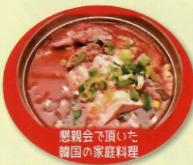
懇親会で頂いた 韓国の家庭料理