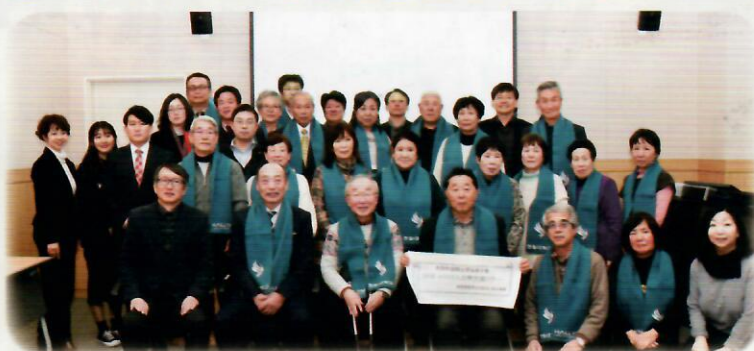
ハンリム大学から頂いた記念のマフラーを参加者全員が巻いて記念写真