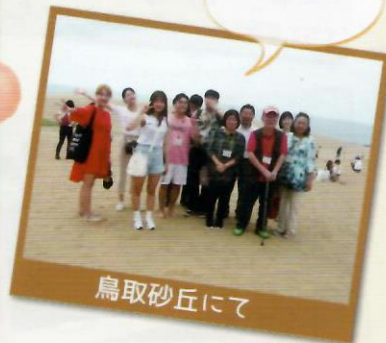
鳥取砂丘へ、協会メンバーと遠足