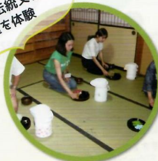
日本の伝統文化 茶道を体験