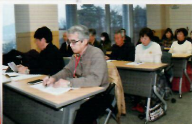
意見交換会に出席した交流の旅参加者