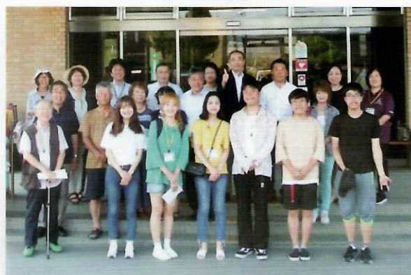
役場前、8日間のホームステイが終わりました